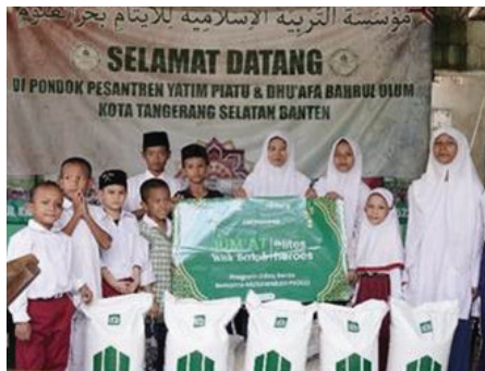
Program CSR: Jum'at Berkah with Elite Heroes 15 November 2025

Distribusi Beras 800kg kepada 284 Penerima Manfaat Yatim & Dhuafa ke 5 lokasi yaitu: Darul Ihsan, Sayap Ibu, Yatim Asida, Qod Kafa, Nur Medina di daerah Tangerang Selatan