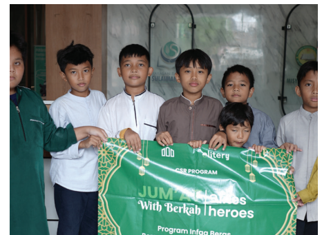
Program CSR: Jum'at Berkah with Elite Heroes 23 Desember 2025

Distribusi Beras 800kg kepada 244 Penerima Manfaat Yatim & Dhuafa ke 5 lokasi yaitu: Bahrul Ulum, At Taubah, Darul Furqon, Sabiluna, Al Barokah di daerah Tangerang Selatan