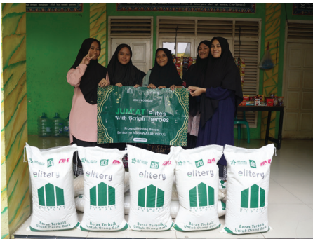
Program CSR: Jum'at Berkah with Elite Heroes 13 Juli 2025

Distribusi Beras 800kg kepada 371 Penerima Manfaat Yatim & Dhuafa ke 5 lokasi yaitu: Al Hanif, Raudhatul Ishlah, Asy Syafiyah, Dzurotul Quran, Quran Madina di daerah Tangerang Selatan