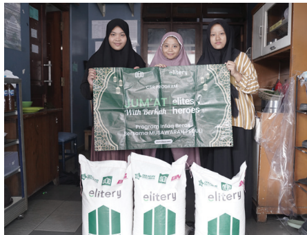
Program CSR: Jum'at Berkah with Elite Heroes 22 Agustus 2025

Distribusi Beras 800kg kepada 371 Penerima Manfaat Yatim & Dhuafa ke 5 lokasi yaitu: Al Hanif, Raudhatul Ishlah, Asy Syafiyah, Dzurotul Quran, Quran Madina di daerah Tangerang Selatan