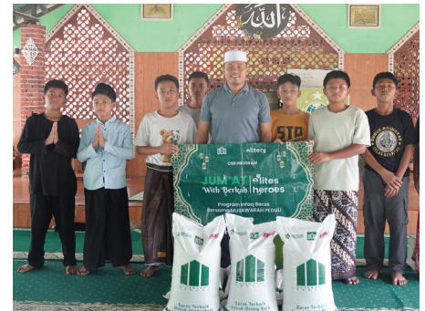
Program CSR: Jum'at Berkah with Elite Heroes 24 September 2025

Distribusi Beras 800kg kepada 207 Penerima Manfaat Yatim & Dhuafa ke 5 lokasi yaitu: Bait Al Hikmah, Al Barokah, Nur Medina, Nurul Hikmah, Ruhama Al Fajar di daerah Tangerang Selatan