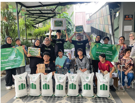
Program CSR: Jum'at Berkah with Elite Heroes 31 Oktober 2025

Distribusi Beras 800kg kepada 288 Penerima Manfaat Yatim & Dhuafa ke 5 lokasi yaitu: Nafidatunnajah, YPMS, Al Manar, Sunanul Husna, Baituna di daerah Tangerang Selatan