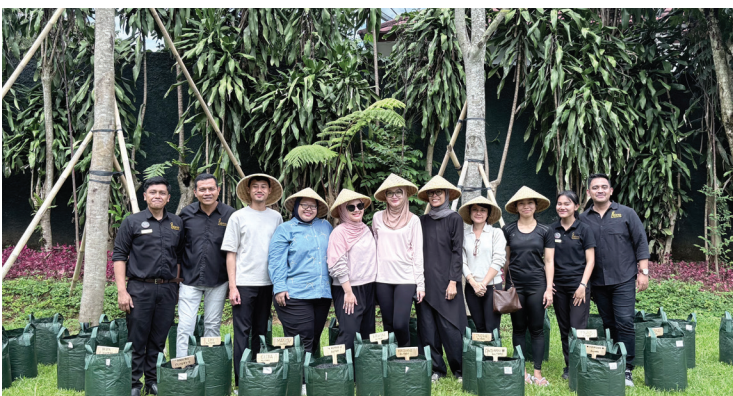
Program CSR : Penanaman Pohon bersama Plataran 5 Desember 2025

Distribusi Beras 800kg kepada 347 Penerima Manfaat Yatim & Dhuafa ke 6 lokasi yaitu: Al mustaqim, At Taubah, Misykatul Ardhi, Bima Azzahra, Baitul Ulum, Sulaimaniyah japos di daerah Tangerang Selatan